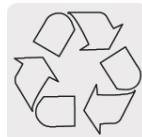
El cobre es un material reciclable