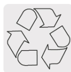
El cobre es un material reciclable